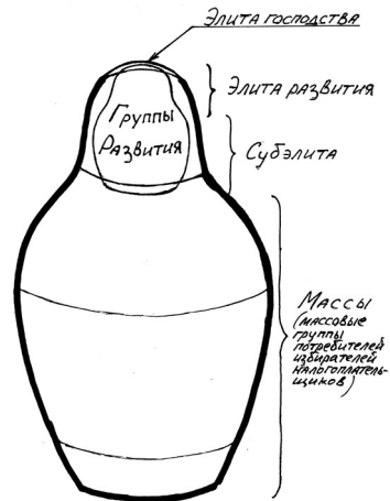
Рис. 2. Наглядное элитоведение